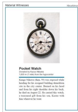
オプションポスター