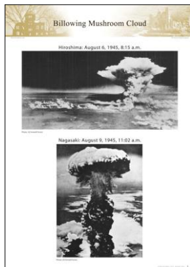
ヒロシマ・ナガサキ原爆写真ポスター

FedEx または DHL のアカウントナンバーを取得の上、申込時に必ずご記入ください。