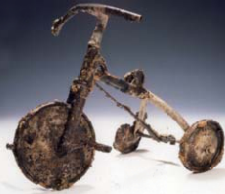
伸ちゃんの三輪車(奇贈/鎌谷信男)