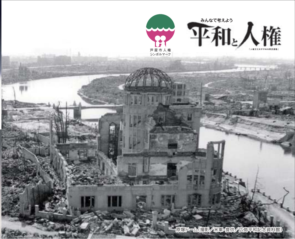
原爆ドーム