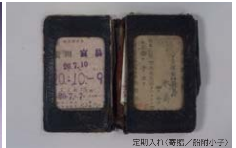
定期入れ(寄贈/船附小子)

写真パネルや被爆者が自ら描いた絵などを展示しています。また、期間中には、被爆体験証言会や被爆体験記朗読会を開催します。被爆の実相に触れ、「こんな思いを他の誰にもさせてはならない」という被爆者の切なる思いを聴き、核兵器廃絶と世界恒久平和の実現に向け、新たな一歩を踏み出す機会となることを心から期待しています。