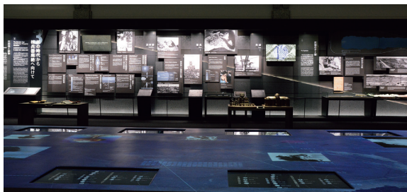
東館3F 核兵器の危険性