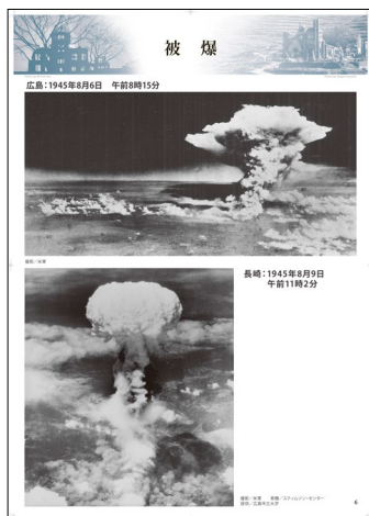
ヒロシマ・ナガサキ原爆写真ポスター