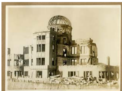
爆心地から約 160m 広島県産業奨励