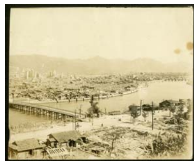
比治山から北西に向かって