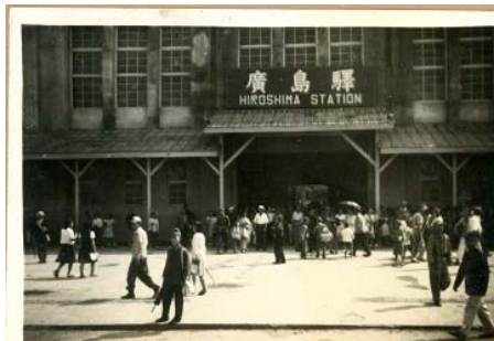
爆心地から約 1,900m 広島駅前

クライヴ・ホロウェイさんは、当時 34 歳。戦後の日本で通訳として対応にあたった。